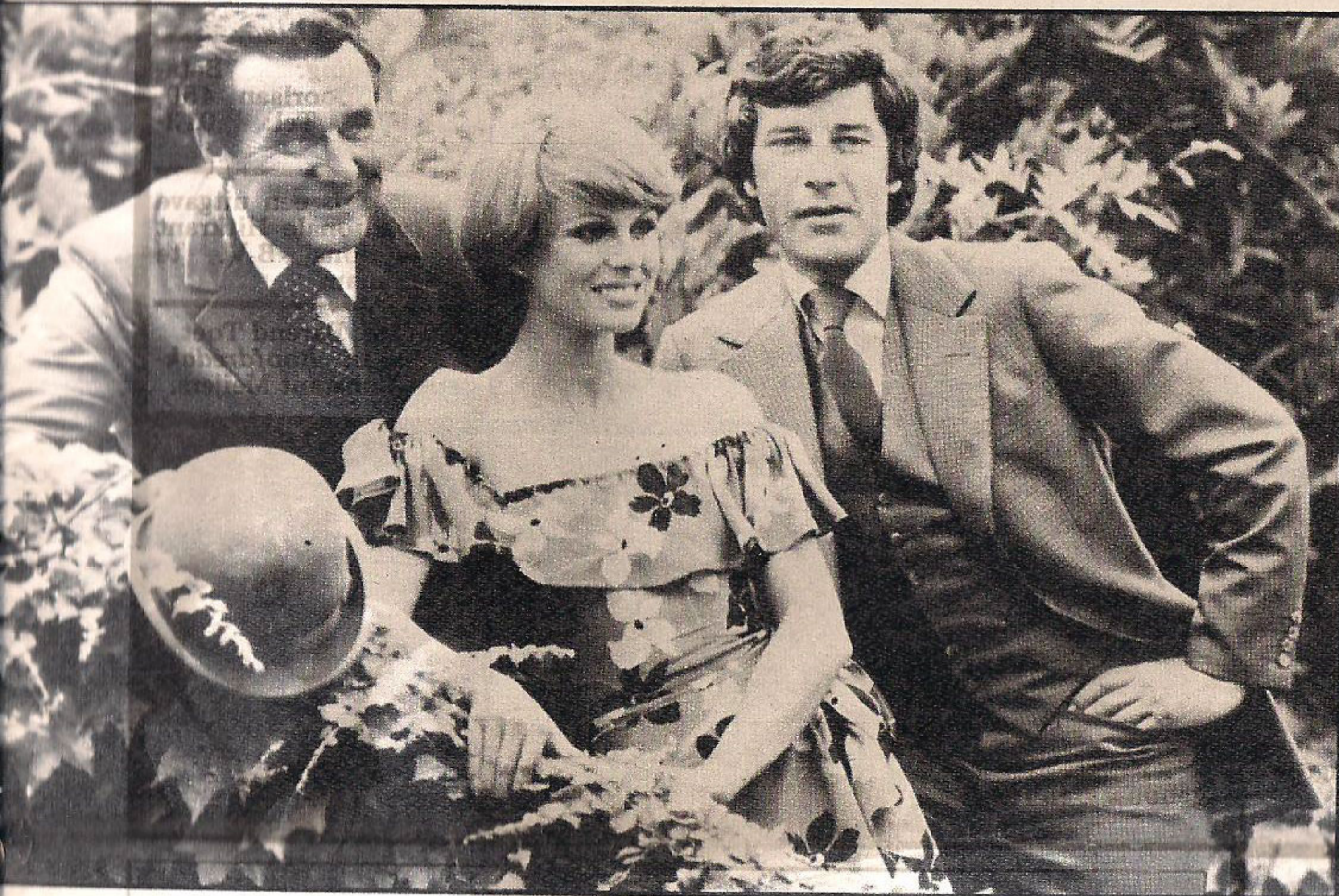
● De Nieuwe Wrekers: populairder dan ooit