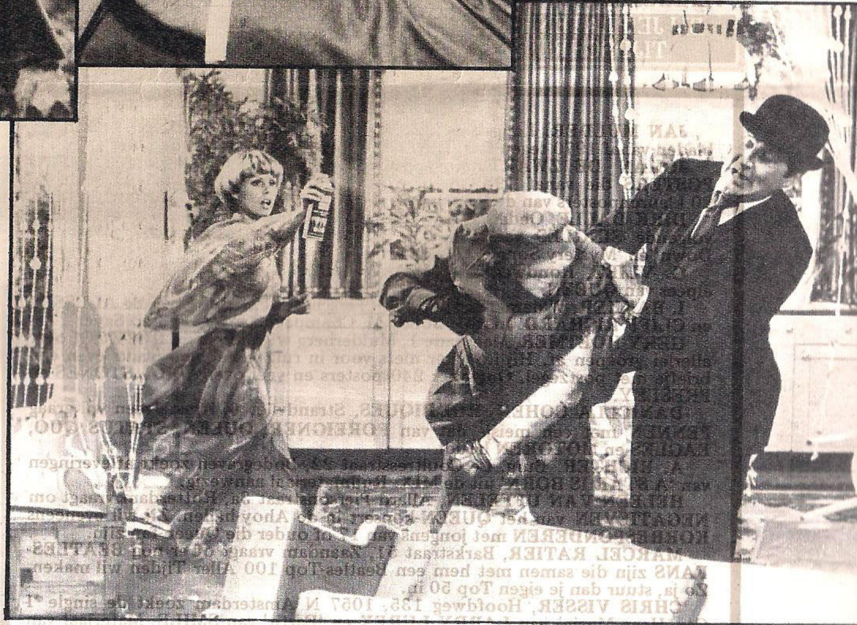
● Steed kan nog aardig mee!

Hij licht, en heeft er ook alle reden toe. Zojuist is men begonnen aan een nieuwe serie van dertien afleveringen. Die zullen volgend jaar in